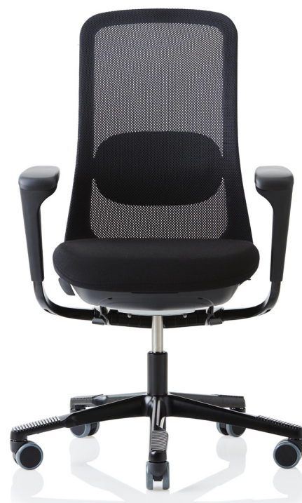
Design: Frost Produkt AS, Powerdesign og Scandinavian Business Seating Design Team Patent- og design beskyttet