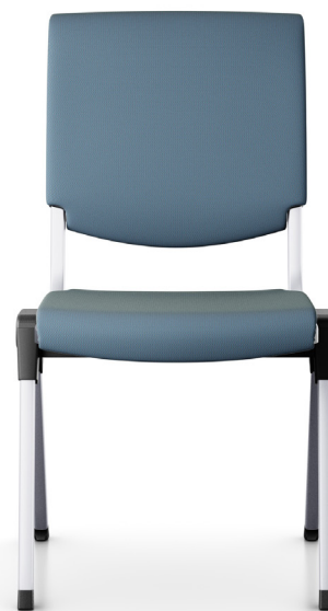
Design: Peter Opsvik Patent- og designbeskyttet