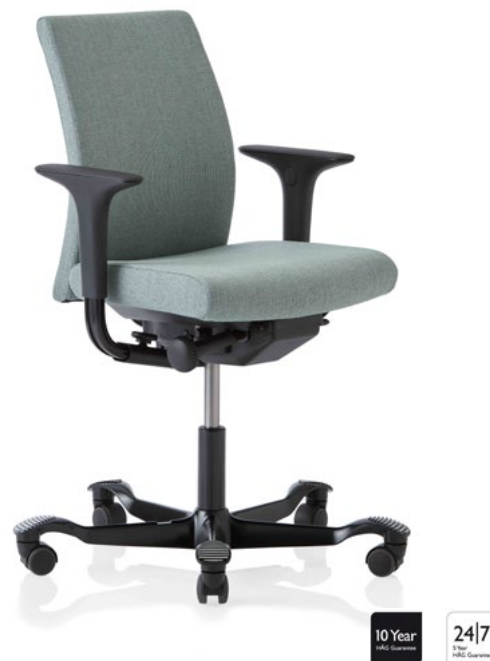
Design: Peter Opsvik. Patent- og designbeskyttet.